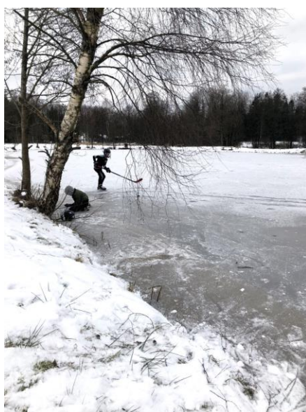
... men vintern kom ändå och dammen förvandlades till hockeybana!

Under de första månaderna arbetade jag med min egen recirkulerande, landbaserade fiskodling, vilket är både kul och inspirerande!