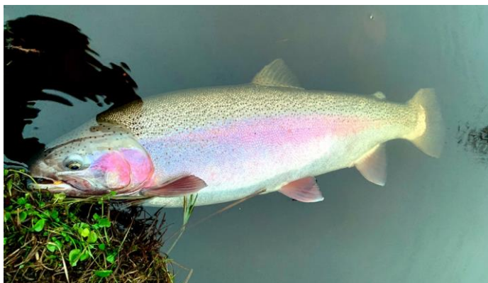
Praktfull Sunnedamms-regnbåge i femkilos klassen!