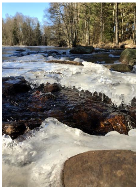
Vänneån 18 mars- vårflod på G!