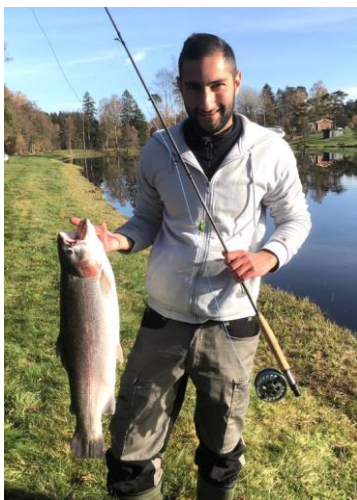
En vacker höstbåge från Sunnedamm, vikt 3,8 kg.