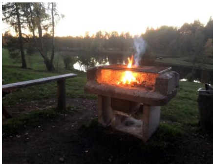
Fiske och grillning i höstskymningen.