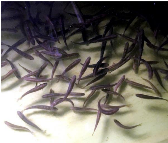
Stridbara Sunnedamms-regnbågar i varande...

Ja, 2017 var verkligen ett händelserikt år. Det var första året, som det odlades upp fisk här på plats. Tidigare år har jag köpt in färdig fisk från externa fiskodlare. Detta får jag visserligen fortsätta med ett tag till, då den egna produktionen ännu inte räcker till, men inom något år så ska förhoppningsvis all fisk, som fångas i Sunnedamm, vara odlad här!