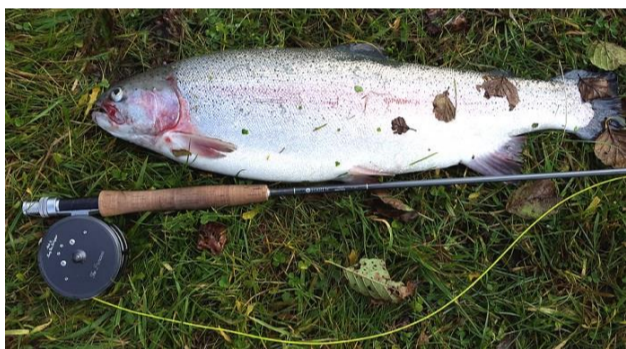
Välväxt regnbåge från Sunnedamm.

värma, då man hittar en hörna av vattensystemet, som med hjälp av vårsolen håller något högre temperatur.