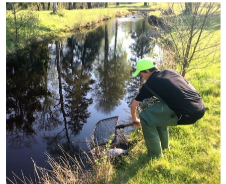
Isättning av fisk i pool 2 i strömsträckan.

Fisket fram till midsommar rullade på av bara farten, jag hade under denna perioden en praktikant här, som går utbildning mot fisketurism. Det borde vara fler, som satsar på fisketurism som yrke. Det finns verkligen en väldigt stor efterfrågan på olika former av fiske som fritidssysselsättning.